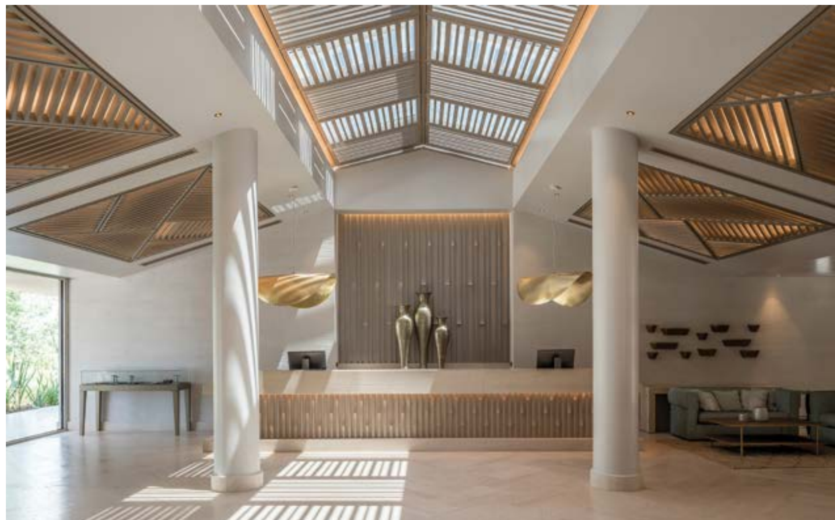
ΑΠΟΨΗ ΤΟΥ ΠΛΗΡΩΣ ΑΝΑΚΑΙΝΙΣΜΕΝΟΥ ΧΩΡΟΥ ΥΠΟΔΟΧΗΣ ΣΤΟ ΚΕΝΤΡΙΚΟ ΚΤΙΡΙΟ.

Οι κτιριακές εγκαταστάσεις εκσυγχρονίστηκαν στο σύνολό τους, αφού αποξηλώθηκαν όλες οι εξωτερικές και εσωτερικές τοιχοποιίες και ουσιαστικά έμεινε ανέπαφος μόνο ο φέρων οργανισμός των κτιρίων. Το "Porto Sani" διαθέτει 98 σουίτες διαφόρων τύπων με ιδιωτικούς κήπους και ευρύχωρες βεράντες με ιδιωτικότητα, η οποία επιτυγχάνεται με την ιδιαίτερη ογκοπλασία των κτιρίων, που διατηρήθηκε από τον αρχικό σχεδιασμό. Οι καθαρές γραμμές των όγκων, η μινιμαλιστική διάθεση με οπτικές φυγές προς τη μαρίνα και τις πισίνες αποτελούν τις βασικές κατευθύνσεις στο σχεδιασμό του συγκροτήματος. Το κεντρικό κτίριο, με ιδιαίτερης μορφής κάτοψη και καμπύλη τη νότια και δυτική του όψη, αποτελείται από τρία επίπεδα. Στο