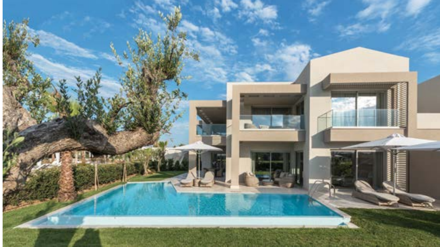
ΔΗΜΙΟΥΡΓΗΘΗΚΑΝ ΜΕΓΑΛΑ ΑΝΟΙΓΜΑΤΑ ΣΤΑ ΔΩΜΑΤΙΑ, ΩΣΤΕ ΝΑ ΥΠΑΡΧΕΙ ΣΥΝΕΧΕΙΑ ΤΟΥ ΕΞΩΤΕΡΙΚΟΥ ΚΑΙ ΤΟΥ ΕΣΩΤΕΡΙΚΟΥ ΧΩΡΟΥ.