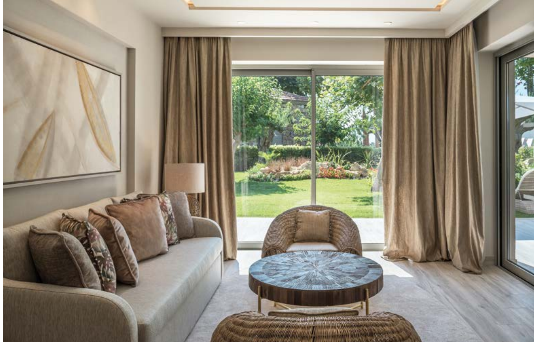
ΤΟ "PORTO SANI" ΔΙΑΘΕΤΕΙ 98 ΣΟΥΙΤΕΣ ΔΙΑΦΕΡΩΝ ΤΥΠΩΝ ΜΕ ΙΔΙΩΤΙΚΟΥΣ ΚΗΠΟΥΣ ΚΑΙ ΕΥΡΥΧΩΡΕΣ ΒΕΡΑΝΤΕΣ ΜΕ ΙΔΙΩΤΙΚΟΤΗΤΑ.

ΟΛΕΣ ΟΙ ΗΛΕΚΤΡΙΚΕΣ, ΜΗΧΑΝΟΛΟΓΙΚΕΣ ΚΑΙ ΥΔΡΑΥΛΙΚΕΣ ΕΓΚΑΤΑΣΤΑΣΕΙΣ ΑΝΤΙΚΑΤΑΣΤΑΘΗΚΑΝ.