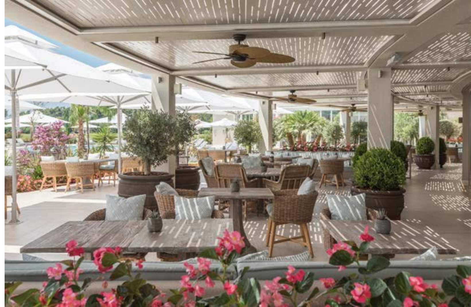
ΤΑ ΣΤΕΓΑΣΤΡΑ ΤΩΝ ΒΕΡΑΝΤΩΝ ΚΑΙ ΟΙ ΠΕΡΓΚΟΛΕΣ ΠΡΟΣΦΕΡΟΥΝ ΗΛΙΟΠΡΟΣΤΑΣΙΑ, ΦΥΣΙΚΟ ΑΕΡΙΣΜΟ ΚΑΙ ΔΡΟΣΙΑ ΣΕ ΟΛΟΥΣ ΤΟΥΣ ΧΩΡΟΥΣ.

Ο ΣΥΝΔΥΑΣΜΟΣ ΦΥΣΙΚΟΥ ΚΑΙ ΤΕΧΝΗΤΟΥ ΦΩΤΙΣΜΟΥ ΣΕ ΣΥΝΔΥΑΣΜΟ ΜΕ ΤΑ ΖΕΣΤΑ ΓΙΝΗΑ ΧΡΩΜΑΤΑ ΔΗΜΙΟΥΡΓΟΥΝ ΕΥΧΑΡΙΣΤΗ ΚΑΙ ΑΝΕΤΗ ΑΤΜΟΣΦΑΙΡΑ.