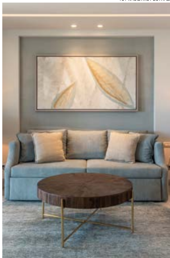
ΛΕΠΤΟΜΕΡΕΙΑ ΤΟΥ ΚΑΘΙΣΤΙΚΟΥ ΣΟΥΙΤΑΣ.

Στο κέλυφος όλων των όγκων έχει τοποθετηθεί σύστημα εξωτερικής θερμομονωτικής προστασίας σε όλα τα δομικά στοιχεία, στέγες, δώματα και εξωτερικές τοιχοποιίες, προς αποφυγή απώλειας θερμότητας και περιορισμού των θερμογεφυρών. Τμήματα δωματίων έχουν επίσης μετατραπεί σε φυτεμένα βελτιώνοντας το περιβαλλοντικό αποτύπωμα των κτιρίων, αλλά και την οπτική άνεση και δημιουργώντας ένα ευχάριστα υγιές και δροσερό περιβάλλον.