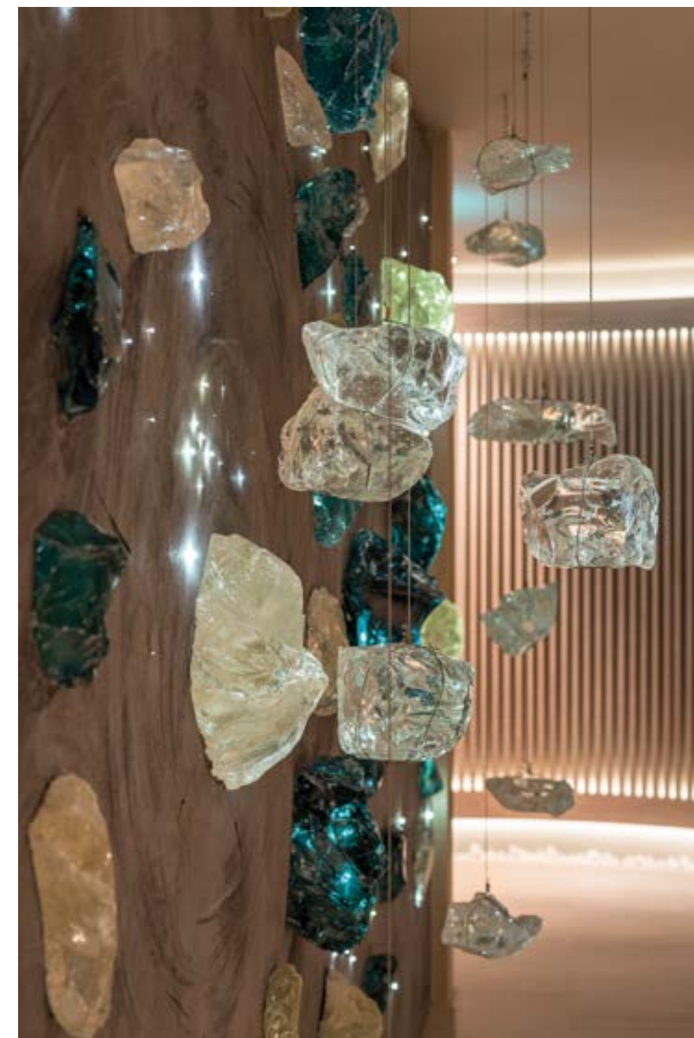
ΕΝΑ ΓΛΥΠΤΟ ΤΟΥ ΕΙΚΑΣΤΙΚΟΥ ΚΩΣΤΑ ΒΑΡΩΤΣΟΥ ΔΕΣΠΟΖΕΙ ΣΤΟ ΚΕΝΤΡΙΚΟ ΚΤΙΡΙΟ.