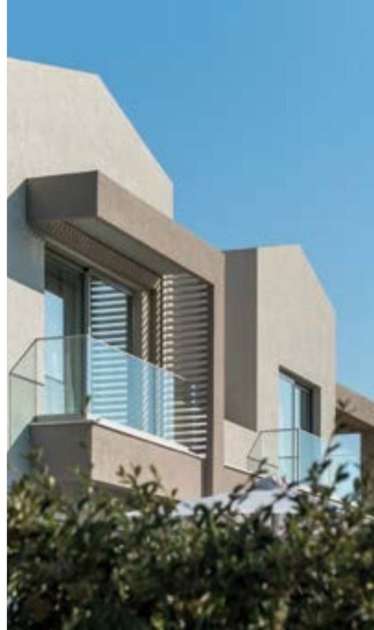
ΣΤΟ ΚΕΛΥΦΟΣ ΟΛΩΝ ΤΩΝ ΟΪΚΩΝ ΕΧΕΙ ΤΟΠΟΘΕΤΗΘΕΙ ΣΥΣΤΗΜΑ ΕΞΩΤΕΡΙΚΗΣ ΘΕΡΜΟΜΟΝΩΣΗΣ ΣΕ ΟΛΑ ΤΑ ΔΟΜΙΚΑ ΣΤΟΙΧΕΙΑ.